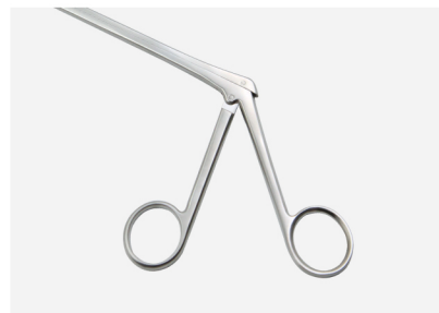
Finger ring style